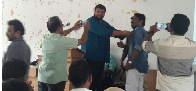
മലപ്പുറം : സംരംഭകർക്കുള്ള ഐ.ഡി. കാർഡ് വിതരണം