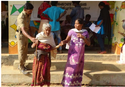
അട്ടപ്പാടിയിലെ ആധാർ എൻറോൾമെന്റ് ക്യാമ്പിൽനിന്ന്

പാലക്കാട് ജില്ലയിലെ അട്ടപ്പാടി ആദിവാസി ഊരുകളിൽ ആധാർ എൻറോൾമെന്റ്, ഇലക്ഷൻ ഐഡി, ബാങ്ക് അക്കൗണ്ട് തുടങ്ങൽ എന്നിവയ്ക്ക് അക്ഷയയുടെ നേതൃത്വത്തിൽ സൗകര്യമൊരുക്കി. അട്ടപ്പാടിയിലെ പത്ത് ഊരുകളിലെ ജനങ്ങൾക്ക് ഇതിന്റെ പ്രയോജനം ലഭിച്ചു. അട്ടപ്പാടിയിലെ മുഴുവനാളുകൾക്കും ആധാർ ലഭ്യമാക്കാനുള്ള അട്ടപ്പാടി മിഷന്റെ ഭാഗമായിട്ടായിരുന്നു പരിപാടി. 112 പേർ ആധാർ എൻറോൾമെന്റ് നടത്തി. 62 പേർ ഇലക്ഷൻ ഐഡി കാർഡിന് രജിസ്റ്റർ ചെയ്തു. 52 പേർ ബാങ്ക്