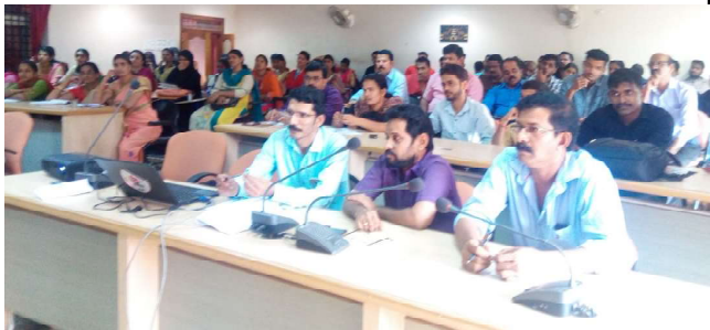
കാസർഗോഡ് : ഇഗ്നോ, ഇലക്ഷൻ ഐ.ഡി, ലേബർ ഡിപ്പാർട്ട്മെന്റ് ഓൺലൈൻ രജിസ്ട്രേഷൻ പരിശീലനം