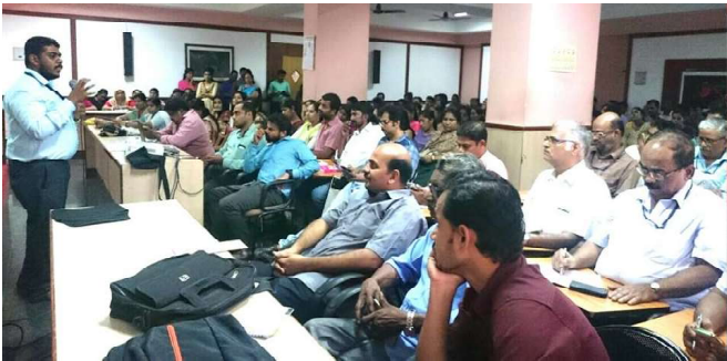
പാലക്കാട് : ഓൺലൈൻ ലാന്റ് ടാക്സ് പെയ്മെന്റ് പരിശീലനം