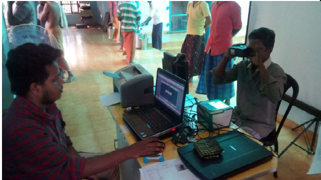
എറണാകുളം : കാക്കനാട് ജില്ലാ ജയിലിൽ ആധാർ എൻഡ്രോൾ മെന്റ്