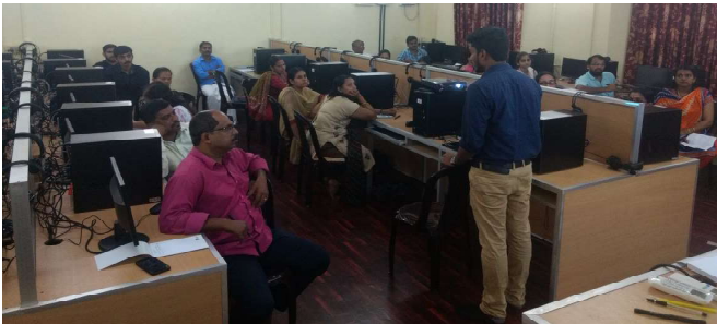
കണ്ണൂർ : കപ്പാസിറ്റി ബിൽഡിംഗ് ട്രെയിനിംഗ്